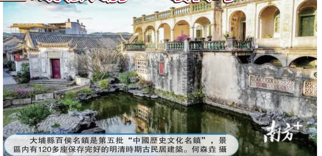
大埔縣百侯名鎮是第五批“中國歷史文化名鎮”，景區內有120多座保存完好的明清時期古民居建築。