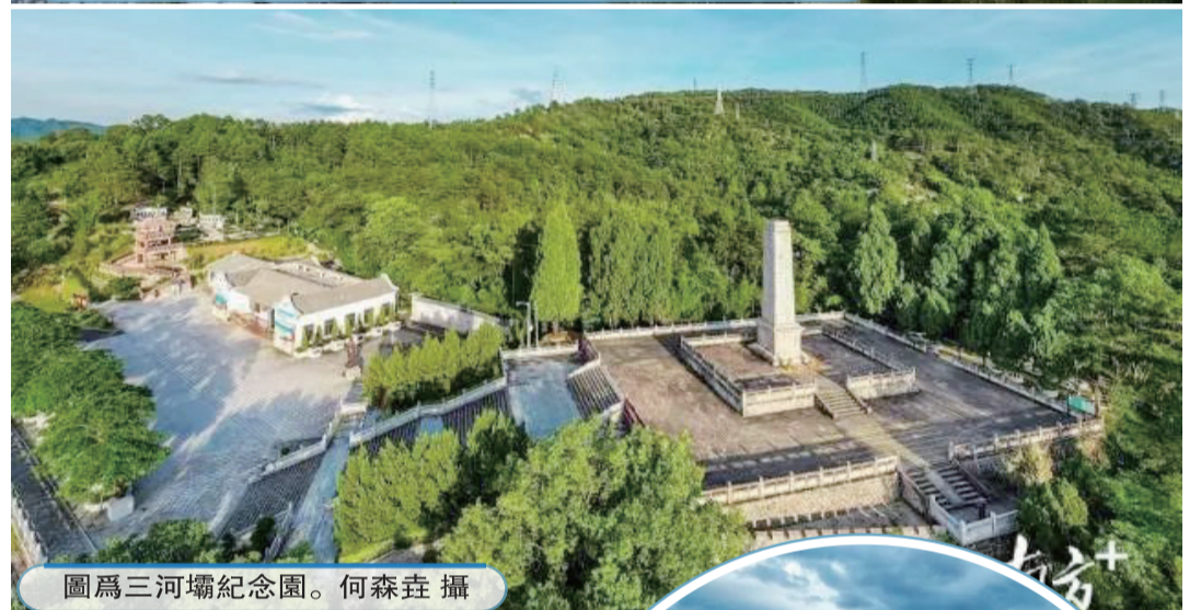
圖為三河壩紀念園。