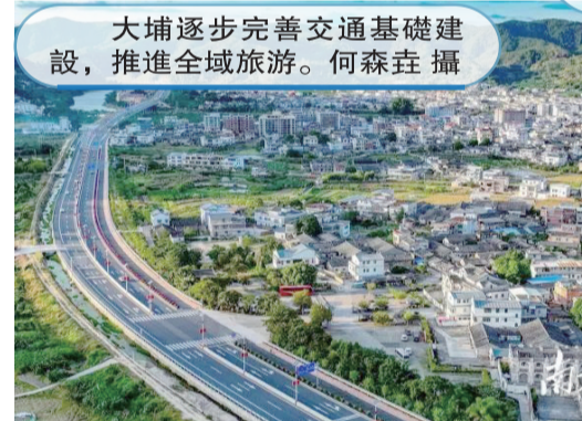
大埔逐步完善交通基礎建設，推進全域旅遊。